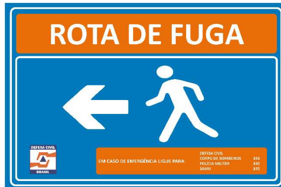
Figura 4 - Modelo de Placa de Rota de Fuga (Seta para a Esquerda).